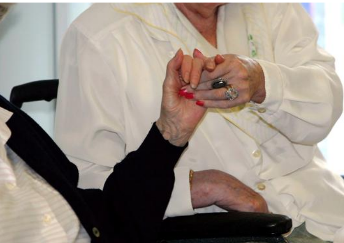
Aider les aidants pour qu'ils puissent se reposer sans souci.

L'association ASDEPAL porte le projet d'une maison d'accompagnement pour des personnes nécessitant des soins de longue durée, afin de permettre aux aidants de souffler. Le 15 octobre, un concert est organisé à Preuschdorf au bénéfice du projet.